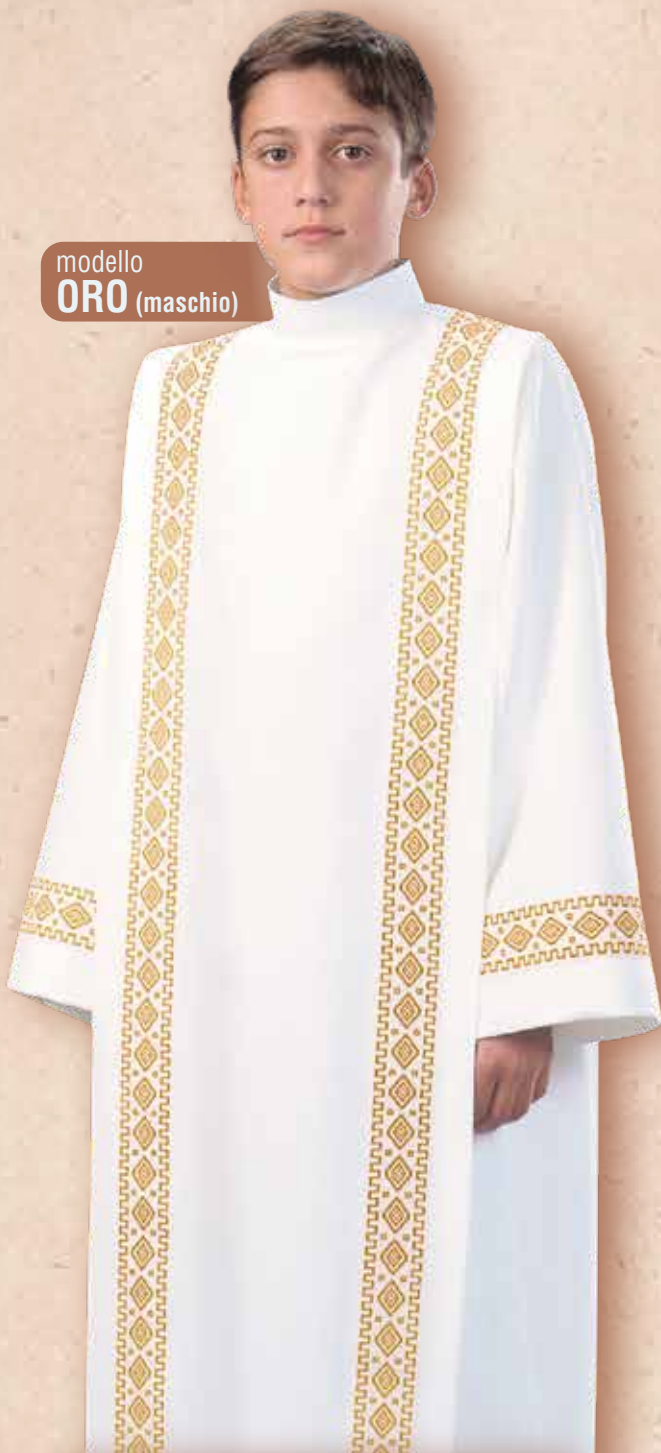
modello ORO (maschio)